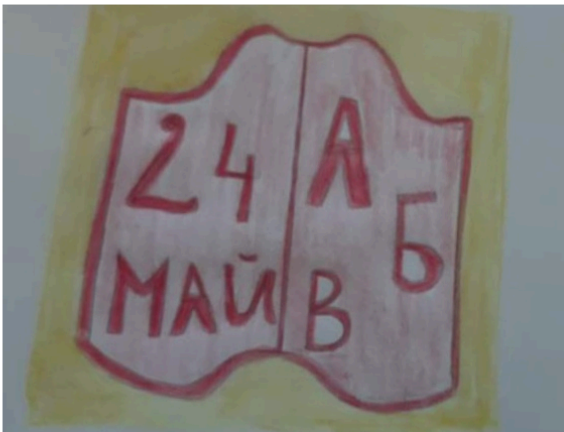
Даниел Антонов – 7. б клас